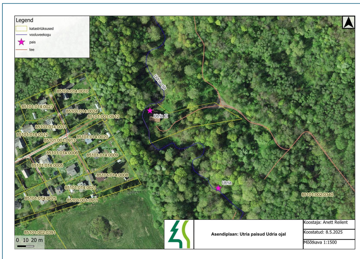
Joonis 1. Paisude asukohad Utria ojal.

Utria oja ei kuulu Utria II paisu asukohas riigi poolt korrashoitava eesvoolu hulka ega ole alamjooksul osa maaparandussüsteemist.