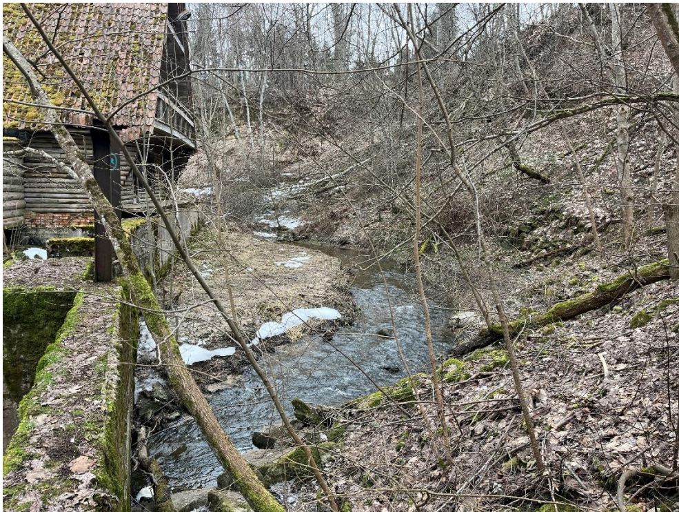
Joonis 4. Utria II paisu paisjärv ei ole säilinud ning kujunenud on kõvapõhjaline voolsäng.