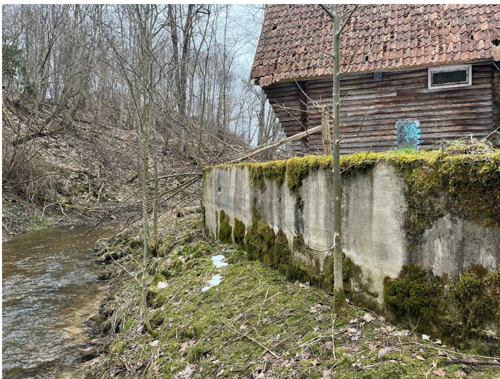
Joonis 3. Maja kõrval olev betoon säilitatakse või lammutatakse vastavalt omaniku soovile.