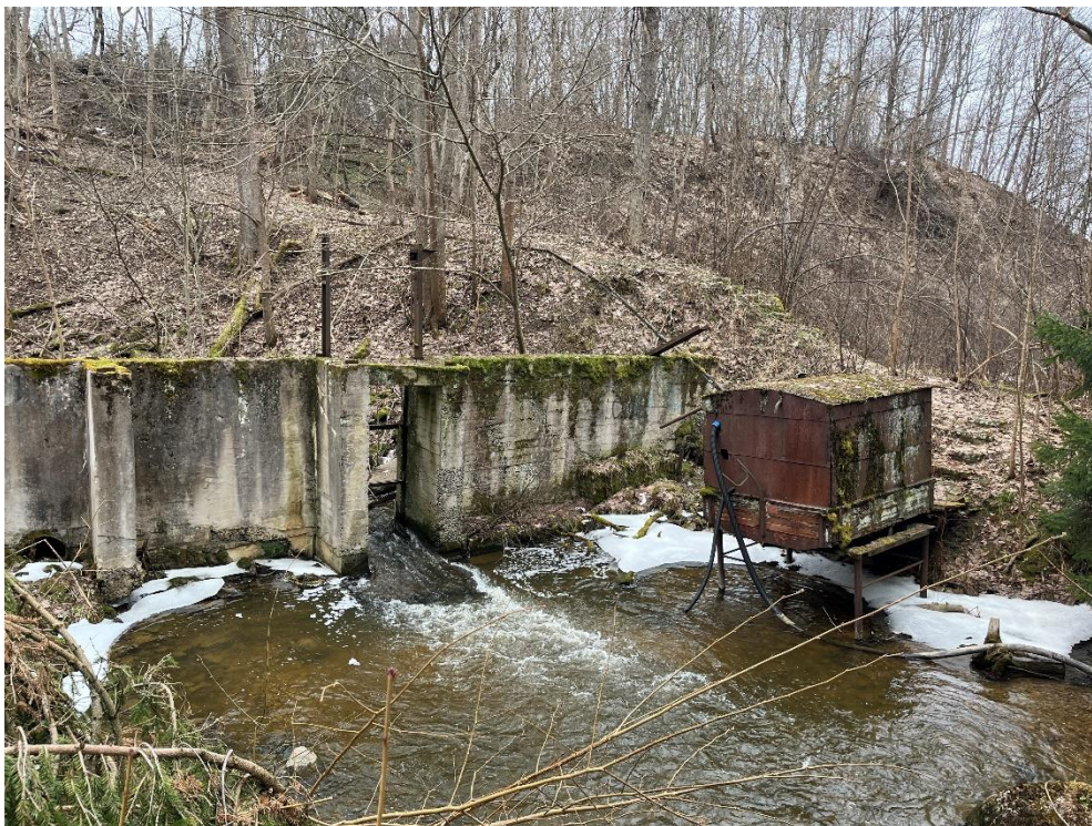
Joonis 5. Utria II paisu likvideerimistöödeks ligipääs saab tõenäoliselt olema vasakkaldalt mööda vana teed, mis toob raudmajakeseni.