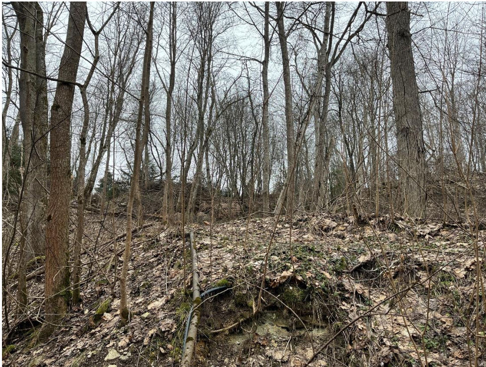
Joonis 6. Vana ligipääsutee on osaliselt metsastunud.