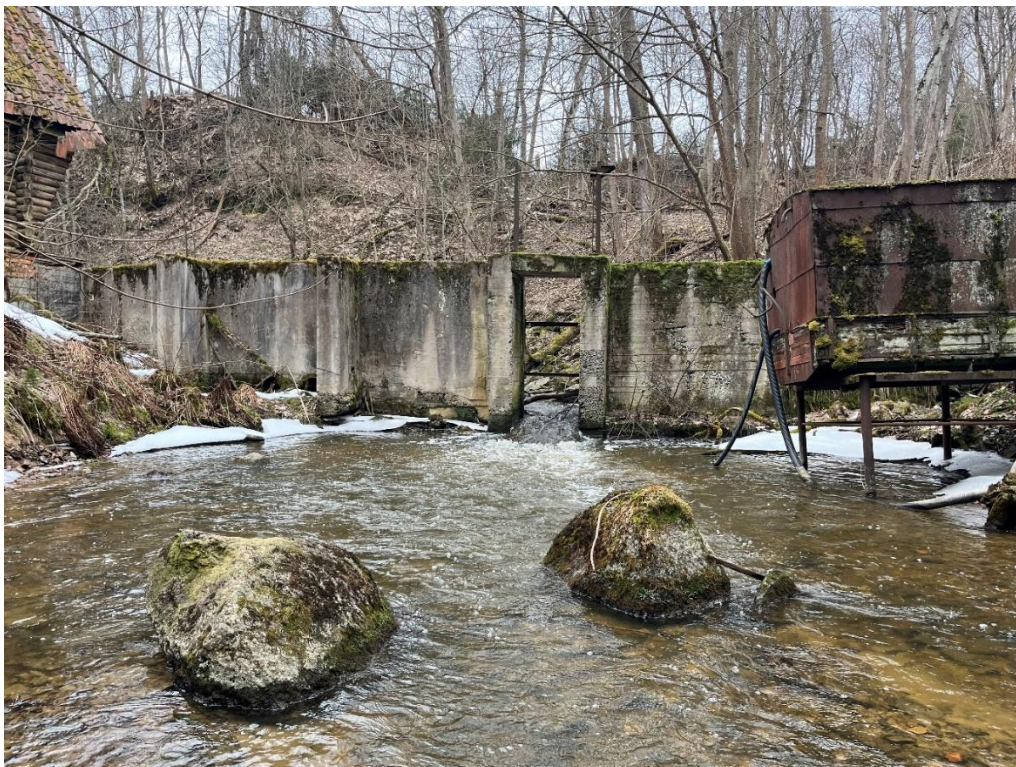
Joonis 2. Utria II paisu betoonkeha on säilinud ja tekitab 0,25 m kõrguse astangu. Vee läbivool toimub kitsa ülevooluava kaudu.